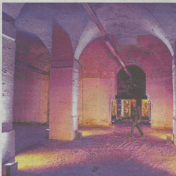
La salle des voûtes, qui n'ouvrira elle qu'en 2015, accueillera événements et concerts.